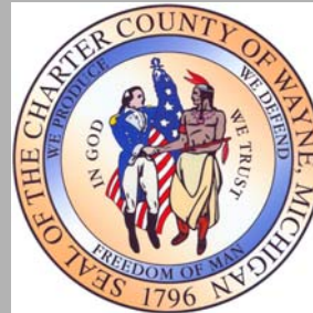
Robert A. Ficano Wayne County Executive

في العام 2002، كان في الولايات المتحدة ما يزيد عن 4161 حالة إصابة بشرية بالتهاب فيروس غرب النيل، نتج عنها 277 حالة وفاة. في العام الماضي كان هناك 644 حالة في ولاية ميشيغن وحدها، توفي منها 51 حالة. أما في مقاطعة وين فقط، فقد وقعت 121 إصابة، توفي 7 منها.